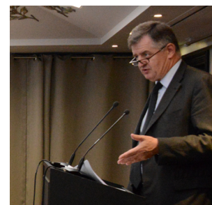
Déjeuner-débat avec Augustin de Romanet